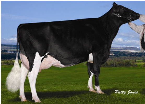
COMESTAR LAUTAMA GOLDWYN GRANDDAM